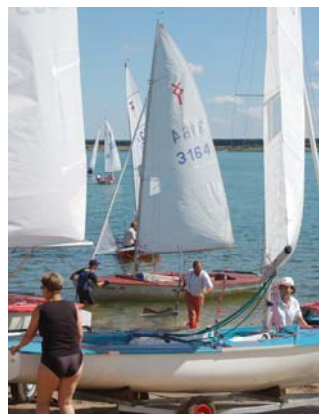
Lausitzer Segelwoche 2007

Oh, es gibt so viele Wünsche, sich zu auf drei zu konzentrieren ist schwer. Aber an erster Stelle wünsche ich mir natürlich, dass aus der Stelle des Hafenermeisters für mich mal ein fester Arbeitsplatz entsteht und ich aus meiner Arbeitslosigkeit herauskomme. Dann hoffe ich natürlich sehr, dass wir als Wassersportverein von den Provisorien wegkommen und das unser Vereinsgebäude fertig wird. Und für den See und seine Entwicklung hoffe ich, dass der Wasserspiegel weiter ansteigt. (RS)