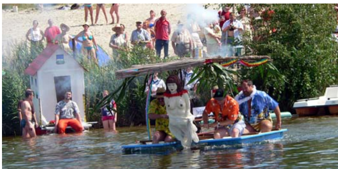
Teilnehmer der Gaudiregatta 2007

Eine Auswahl der zugesendeten Bilder werden wir in der nächsten Ausgabe Anfang November präsentieren.